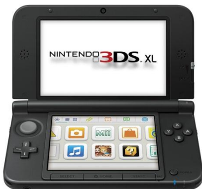
NINTENDO 3DS XL