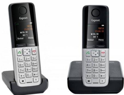
DUO GIGASET C300