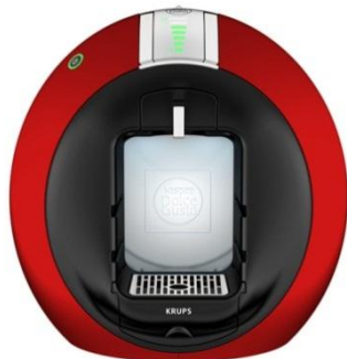
ESPRESSO AUTOMÁTICA KRUPS