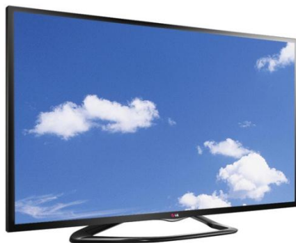
TV LED 55"